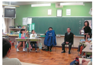
地元の小学生へ清掃活動の講演も実施

"Let's clean up our town!" With this shared goal in mind, the Roppongi merchants and neighborhood associations got together and launched regular clean up activities in 1997. Since then our group that consists principally of volunteers in the area have met about 400 times to keep our city clean. Over this ten-year period, our beautification activities have also included promotion to encourage people to stop throwing their cigarette butts and litter away on our streets and raise general community awareness about this issue. Every Friday evening, you will find employees from neighborhood businesses and parents together with their kids among our volunteers. In the future, you can count on us to continue our endeavors to achieve our goal: a litter-free and crime-free Roppongi!