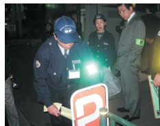
連日、水・木を中心に夜のパトロールを実施

Operating mainly in the Roppongi shopping quarter and neighborhood association district, our security patrols are working to help keep the night free from crime. Launched in December 2004 in cooperation and under the supervision of the police, we have been conducting area patrols during which we perform various tasks including removal of signboards on the street, and attachment of warnings to illegally parked bicycles. Sometimes we remove enough signs to fill two trucks! We want to restore the charm of Roppongi - a town that everyone wanted to experience. Tonight we are again on patrol so visitors can enjoy this wonderful place in safety.