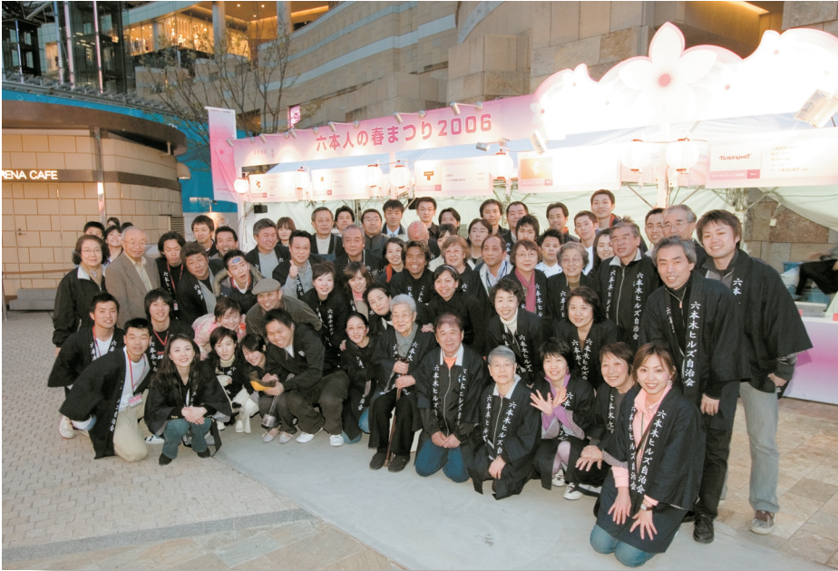
みんなが力を合わせて春まつりは大盛況! @4/9 六本人の春まつり 2006 Fun and Festive Spirit! @ Roppongi Hills Spring Festival 2006 4/9