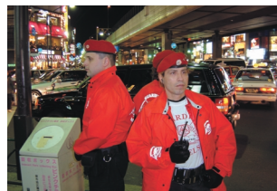
外国人が多い街なので海外出身のメンバーも多く参加