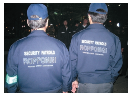
そろいのユニフォームで夜の六本木を巡回