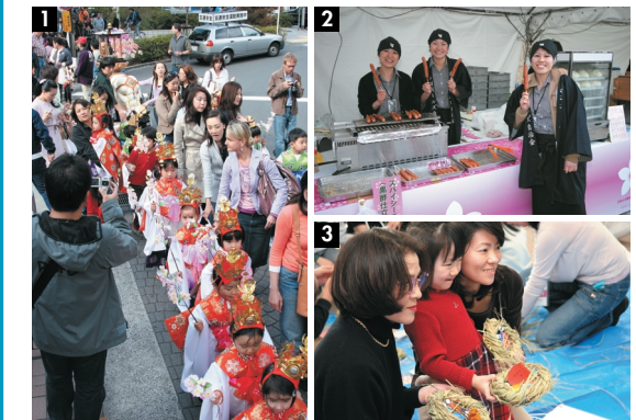
1.外国人子女の参加も多いインターナショナルな稚児行列 2.ヒルズが誇るグルメ屋台は今年も大好評 3.日本古来の風習にふさわしい、手作りの福の舟と紙人形を毛利庭園に放流

Roppongi Hills Spring Festival 2006 Report During the three days of Roppongi Hills Spring Festival from April 7(Fri)-9(Sun), the community was filled with the vitality of the season. Though the cherry blossoms were just a little past their prime, it did not dampen the spirits of the crowds of visitors taking advantage of delicious goodies at the gourmet wagons and wonderful items at the sales wagons. There was much for kids to see and do including performances at Mohri Garden, the soccer game at the TV Asahi booth and the Captain Kid game sponsored by the neighborhood association. Another spring filled with fun and good cheer has come to the Hills!