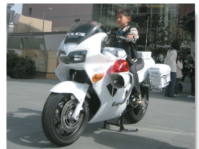
バイクに乗る時はヘルメット着用だよ! @4/15 春の交通安全運動 "Ride a Motorbike, Wear a Helmet!" @ Spring Traffic Safety Campaign 4/15