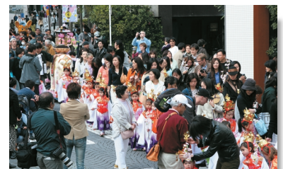
色鮮やかに着飾ったお稚児さんの大行進 @4/9 麻布十番花まつりパレード Children March in Traditional Costumes @ Azabu-Juban Hana Matsuri Parade 4/9