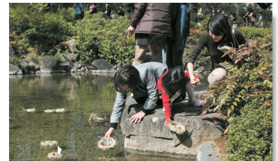
今年も平穏な一年になりますように@4/9 流し雛 Wishes for Peace and Prosperity in 2006! @ Nagashi-bina(Floating of the Dolls)Ceremony 4/9