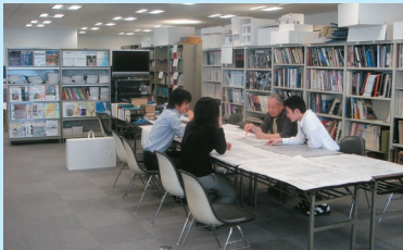
ライブラリーでの打合せ