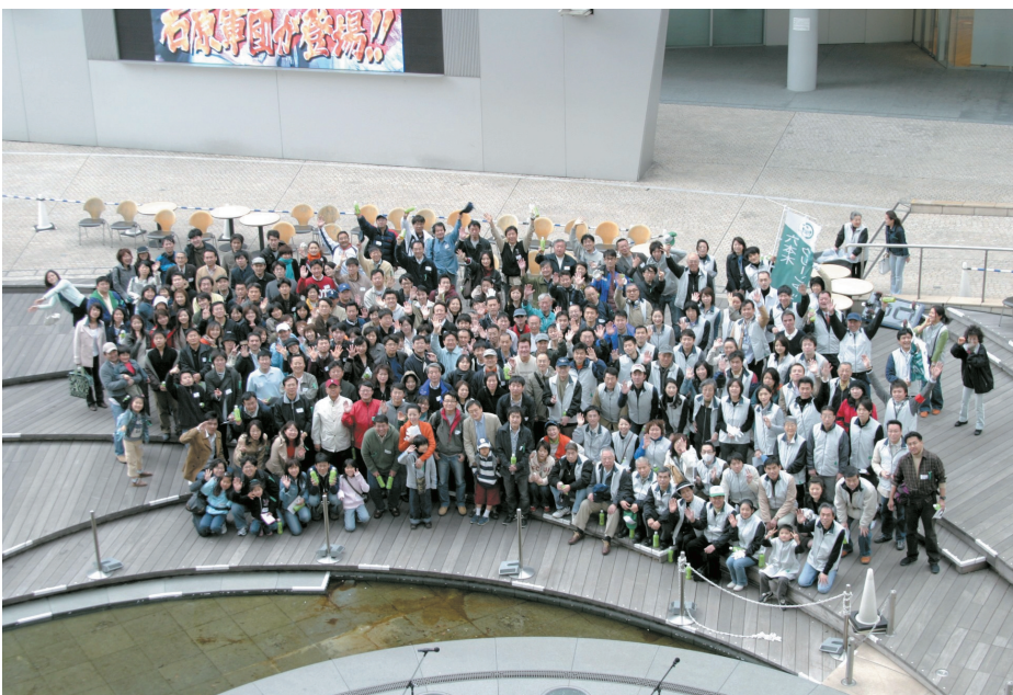
260名の六本木“犬” クリーンアップ! @4/8 GREEN ROAD SIX + 六本木クリーンアップ Giant 260-member Clean Up! @ GREEN ROAD SIX + Roppongi Clean Up 4/8