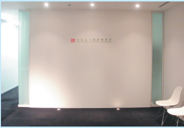
森タワー42階エントランス