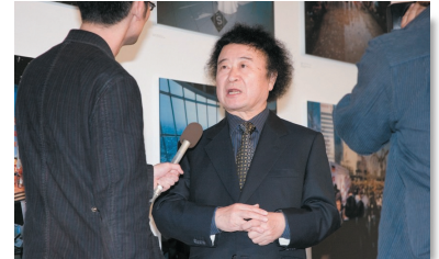
「六本木ヒルズの今」がおもしろい! @4/25~5/14「六本木ヒルズ×篠山紀信」写真展 Roppongi Hills Moments! @ ROPPONGI HILLS KISHIN SHINOYAMA Photo Exhibition 4/25-5/14