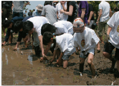
1. 今年は京都とコラボレーション @田植え 2008 Kyoto collaboration @ Rice Planting