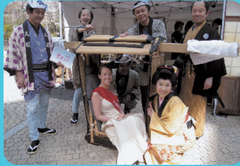
桜のプリンセスを囲んで