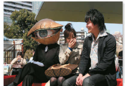
6. こっちを見ないで @春まつりパフォーマンス “Don’t Look!” @ Spring Festival performance