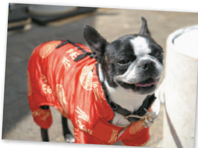
7. 売上げに貢献! 南翔饅頭店の看板犬 @春まつり The Nanxiang Steamed Bun Restaurant mascot dog draws customers @ Spring Festival