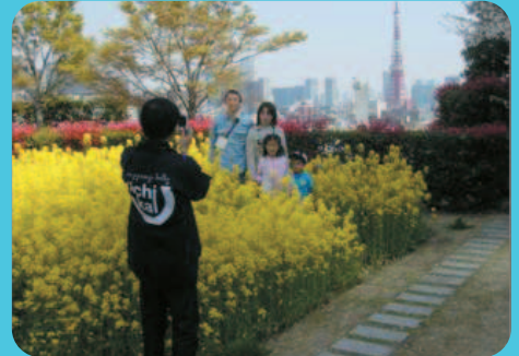
オープンガーデン菜の花畑で記念撮影