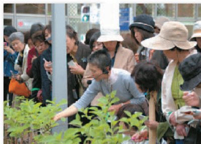
8. ヒルズガーデニングクラブが誕生 @さくら坂 Hills Gardening Club debuts @ Sakurazaka