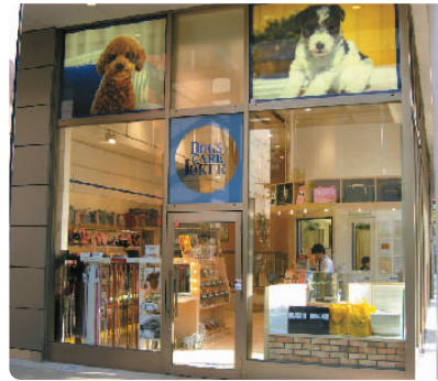
ドッグス ケア ジョーカー (六本木けやき坂通り3F) 営業時間 11:00~21:00 電話番号 03-5786-7711