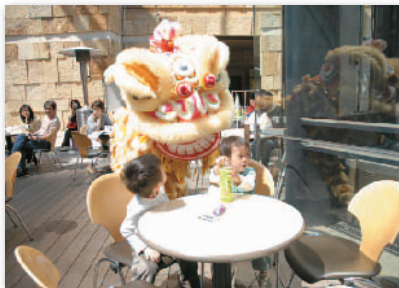
4. 獅子舞にビックリ! @春まつり Lion Dance @ Spring Festival