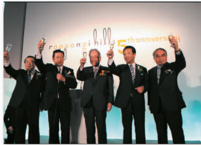
2. 登壇者による乾杯 @5周年レセプション Toast by VIPs on the dais @ 5th Anniversary Reception Party