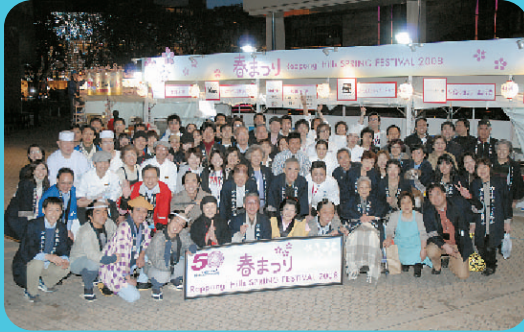
スタッフも楽しみました!

Blessed with superb weather, the 4th Hills Spring Festival was bigger and better than ever. From the "Open Garden" (special opening of the rooftop garden) to Asahi TV's period drama tearoom, this year's event featured a variety of new attractions to bring smiles to the faces of the young and old throughout the 3 days.