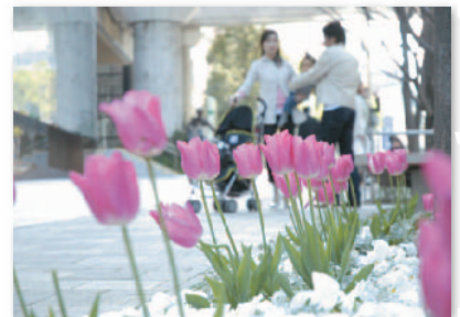
9. けやき坂のチューリップ Tulips on Keyakizaka