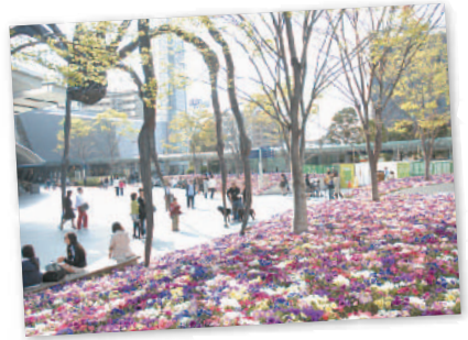
3. 66プラザにお花畑が出現 Flower garden debuts at 66 Plaza