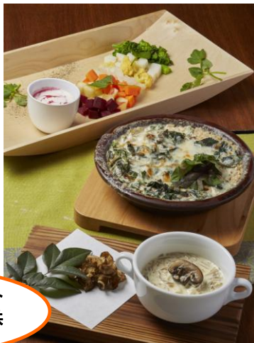
3つのお料理をセットにしたランチもご提供