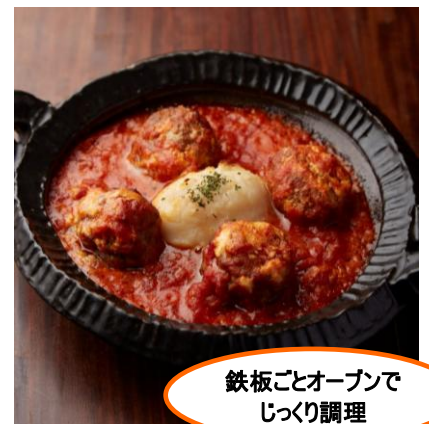
鉄板ごとオープンでじっくり調理