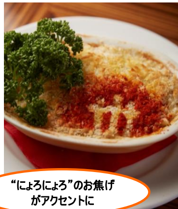
“にほんブログ村”のお焦げがアクセントに