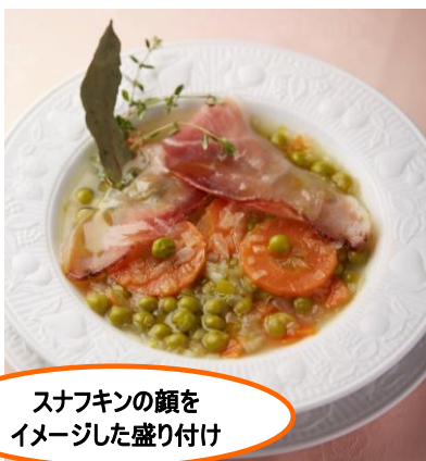
スナフキンの顔をイメージした盛り付け