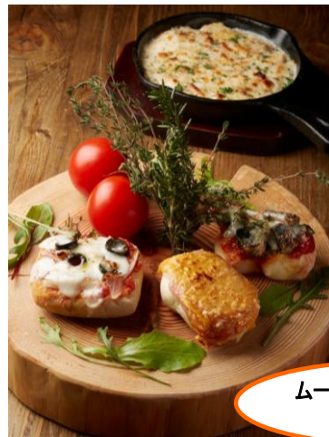
ムーミン谷をイメージした盛り付け