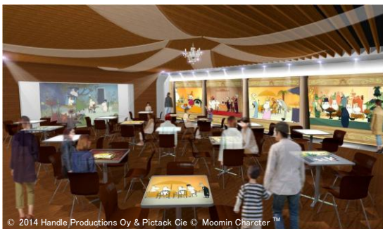
© 2014 Handle Productions Oy & Pictack Cie © Moomin Character™