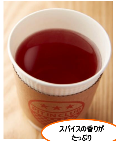
ピットインクラブ (ウェストウォーク 6F)