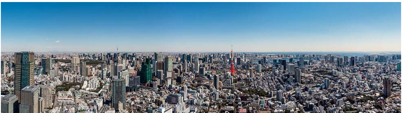
『Museum Cafe & Restaurant THE SUN & THE MOON』からパノラマビューが臨めます(※写真はイメージです)

2015年4月にリニューアルオープンした六本木ヒルズ 森タワー最上層部の楽しみ方に新たな食体験が加わります。