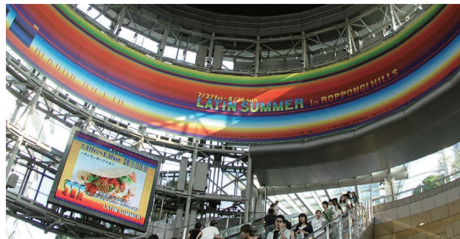
▲メトロハット内周