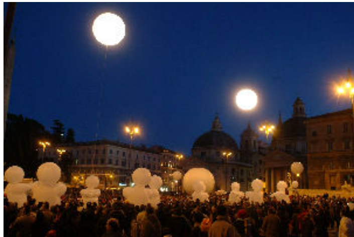
カンパニー・デ・キダム 《ハーバートの夢/Reve d'Herbert》 © cie des Quidams

問 合 せ： 03-5777-8600 (ハローダイヤル) www.roppongiartnight.com