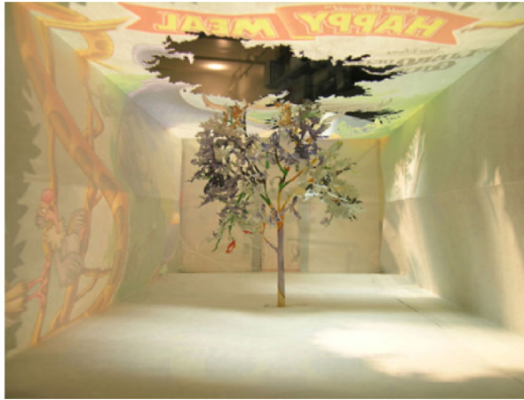
照屋勇賢（告知一森）2005年 紙袋、糊 18cm×8cm×28cm ソロモン・R・グッゲンハイム美術館、ニューヨーク

3 回目を迎える本展には、長いキャリアを持つアーティストから若手注目株まで 20 組が参加し、写真、彫刻、インスタレーション、映像、グラフィティ・アート、パフォーマンスなどを紹介します。