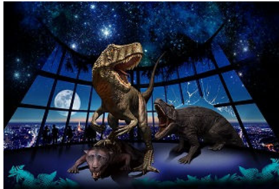
Illustration kayomi tukimoto