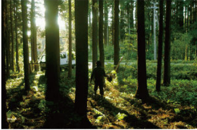
栗林 隆 《石地》2008 ミュースト・メディア 349x569x41.5cm 制作風景: 十和田市現代美術館, 2008年

「ネイチャー・センス展」では、日本の自然観に改めて注目し、現代を生きる日本人の感性や文化的記憶と「自然」の関係性を、現代アートやデザインを通して考えます。展示では、国際的に活躍する吉岡徳仁、篠田太郎、栗林隆の3人のアーティスト/デザイナーが参加し、新作インスタレーションを試みます。