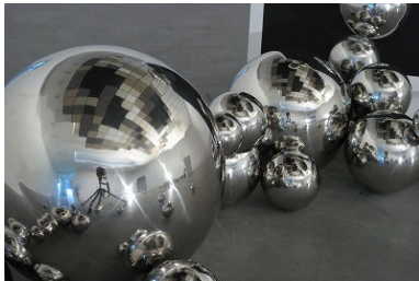
サーダン・アフィフ 《どくろ》2008 年 ロックワール、木、ステンレス鋼球、照明 サイズ可変 展示風景：ペイ・ドラ・ロワール現代芸術振興基金 「ひとつ」展、2008 年 所蔵：フランス国立現代美術コレクション、パリ