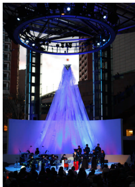
昨年のコンサートの様子