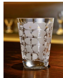
Roppongi LOVE タンブラー ¥21,000

1993年にアンディ・クルーズとリッチー・ロートによって設立されたデザイン会社。日常的に最も身近な「文字」を様々な切り口でデザインし、それらを彼ら独自のフィルターを通して日常の様々な「モノ」に落とし込んでいく手法は、世界中に熱狂的なファンを有する。タイポグラフィーのデザインに留まらず、平面から立体、グラフィックからアート、ファッション、インテリア、音楽へと様々な活躍の場を拓いている。