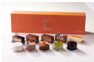
シェフズ タイムライン

バスケット入りLOVEクッキーセット(森美術館「LOVE展」入場チケット2枚付) 6,000円