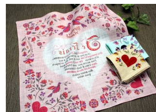
アンティークハート ¥2,100

ブランドイメージテーマでもある、LOVE(ハートデザイン)を表現した新作ハンカチーフが多数登場します。中でも、おすすめのひとつが「アンティークハート」。愛の賛歌をアンティーク調にデザインした、レディースの新作です。素材は麻100%。春先から夏に向けて使い心地よく、季節感にもあふれる色合いです。