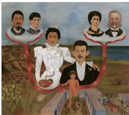
六本木ヒルズ・森美術館 10 周年記念展

人間にとってかけがえのない「愛」をテーマに、美術史を彩る名作や意欲的な現代作品を含む 100 点を通して、恋愛から始まり、家族愛、人類愛、さらにはインターネット社会における新たな絆など、複雑で変化に富んだ愛の諸相を考察します。