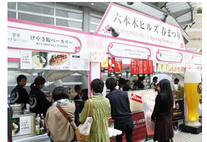
昨年の春まつりの様子

開催日： 2014年4月18日(金)～20日(日) 時間： 18日(金) 16:00～20:00 19日(土) 12:00～22:00 20日(日) 12:00～18:00 場所： 毛利庭園周辺 主催： 六本木ヒルズ自治会、森ビル株式会社