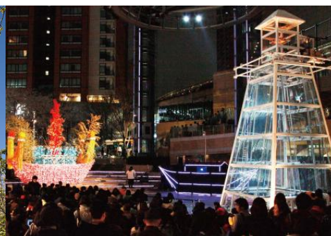
六本木アートナイト 昨年の様子