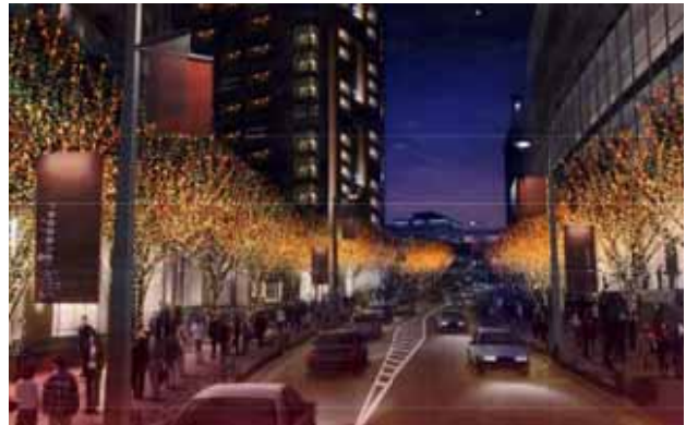
琥珀色の LED “CANDLE&AMBER”(イメージ)