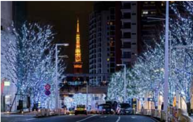
白色と青色の LED “SNOW & BLUE”(昨年の様子)

白色と青色の LED による“SNOW & BLUE”が放つ都会的で洗練されたきらめきと、琥珀色の LED による“CANDLE&AMBER”が持つ力強くかつ温かな光が、新たな彩りで通りを染め上げ、六本木ヒルズのけやき坂が、この時期、この場所でしか巡り合えない光のパワースポットに変身します。また今年は、けやき坂下にスマートフォンと連動した新たな体験型イルミネーションが登場し、イルミネーションの新しい楽しみ方をご提案します。