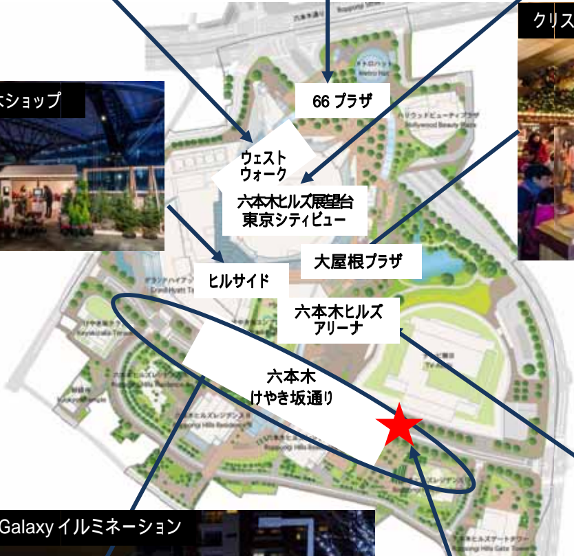
けやき坂 Galaxy イルミネーション