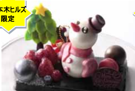
「雪ダルマツケーキ 2016」 限定 100 台 ¥4,860 (ヒルズ ダル・マツ)

ドライフルーツを入れたパウンドケーキの土台にチョコレートのカプセルでできた雪だるま。中にはいちごムースとチョコムースが入っています。(10cm×20cm/4名様分)