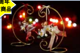
[ラスプ スパイスデコレーション]