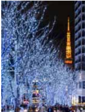
“SNOW & BLUE”

六本木の冬の風物詩「けやき坂 Galaxy イルミネーション」。今年は、2013年に六本木ヒルズ開業10周年を記念してスタートしたセレブレーションカラー“CANDLE&RED”をリニューアルし、新たにアンバー色(琥珀色)とキャンドル色の2色のグラデーションで構成した新色“CANDLE&AMBER”を展開いたします。白色と青色のLEDによる“SNOW & BLUE”が放つ都会的で洗練されたきらめきと、琥珀色のLEDによる“CANDLE&AMBER”が持つ力強くかつ温かな光が、新たな彩りで通りを染め上げ、六本木ヒルズのけやき坂が、この時期、この場所でしか巡り合えない光のパワースポットに変身します。また今年も、けやき坂下にはスマートフォンと連動した新感覚体験型イルミネーションが登場。動かして、持ち帰れる新しいイルミネーションの楽しみ方をご提案します。