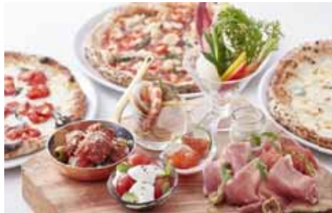
「イタリアンパーティーセット」 ¥4,910 (毛利 Salvatore Cuomo)

メインの鴨のコンフィと、サラミ・チーズ・キッシュ・サーモンテリーヌなどの前菜が盛り合わせになっています。