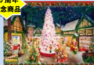
[アドヴェント・ショップ フロム ジャーマニー]