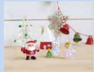
[ジョイラッククラブ]