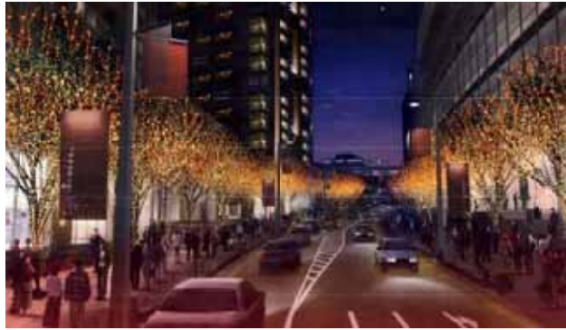
【新色】琥珀色のLED “CANDLE&AMBER”(イメージ)