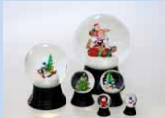
[オリジナル・スノーグローブ]