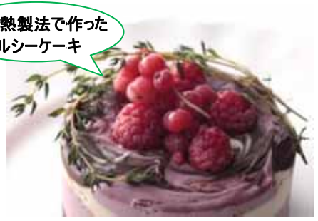
「クリスマスヴィーガンローケーキ」 ¥4,536 (エル カフェ) 限定 30 台

カシューナッツやデーツなどの木の实やココナッツ、フレッシュフルーツを使用。素材の持つビタミンや酵素を壊さないよう、非加熱製法でつくられた手作りケーキです。(12cm / 2~3名様分)