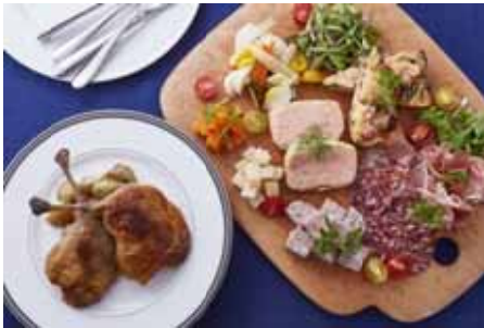
「MARUGO twinkle twinkle Box!」 ¥6,000 (シャポー マルゴ)

メインの鴨のコンフィと、サラミ・チーズ・キッシュ・サーモンテリーヌなどの前菜が盛り合わせになっています。