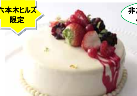
「ガトー・ド・ノエル」 限定 20 台/日 ¥4,000 (ジャン・ジョルジュ 東京)

香味高いアールグレイのムースに「カシスとラズベリーのクリーム」、カシスとラズベリーのジュレに「バイオレット(スマイレ)」の香りを閉じ込め、上質な大人テイストに仕上げました。(直径 12cm / 2~4名様分)