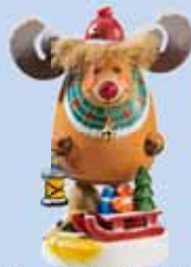
[ケーテ・ウォルフアルト]