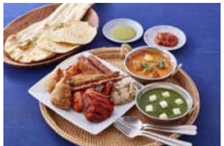
「パーティープレート」 ¥5,400 (DIYA INDIAN RESTAURANT)

9種類のアンティパストが楽しめる六本木ヒルズ限定のテイクアウトセット。ピッツァはスペシャルピッツァ1種と定番2種の3種類の中から、1枚お選びいただけます。