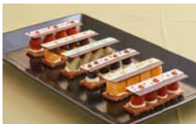
「6 種のフルーツミルフィーユ」 ¥2,400 (イルプリオ)

※2 名様用(ドリンク付)、前日までに要予約。 苺、オレンジ、キウイ、ブルーベリー、マンゴー、フランボワーズの6 種類。