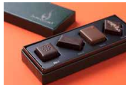
ル ショコラ ドゥ アッシュ 「C.C.C. CHOCOLAT REVOLUTION」 ¥1,901 2016年C.C.C金賞受賞作品。「発酵と発酵のマリアージュ」をテーマに、マルコム株式会社全面協力の元、カカオパルプを米糍と共に発酵させたショコラ。日本古来の発酵食材と掛け合わせた4粒。