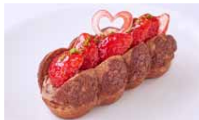
「フルーツパトッシュー フリーズショコラ」 ¥734 (クレーム デ ラ クレーム)

※2 名様用(ドリンク付)、前日までに要予約。 苺、オレンジ、キウイ、ブルーベリー、マンゴー、フランボワーズの6 種類。