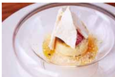
(左)「ブラリネクリームとショコラのパフェとローズヒップとハイビスカスのハーブティー」(THE SUN)