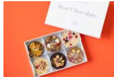
イル カフェ 「ローチョコレート」 ¥4,104(6枚セット) オーガニックカカオを使用し、非加熱で全て手作業で仕上げたローチョコレート。