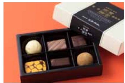
賛否両論 「賛否両論 ショコラアソート 6個」 ¥1,620 日本料理人、笠原将弘氏が贈る6種の和食材(醤油、黒糖蜜きな粉、梅、白胡麻、ほうじ茶、山椒)を使用した、個性的なボンボンショコラです。