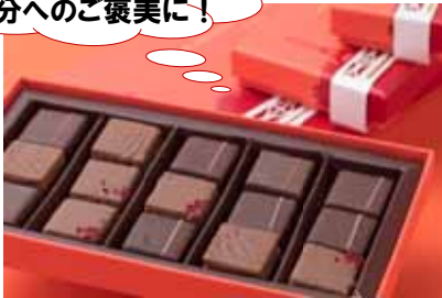
ラ・メゾン・デュ・ショコラ 「ランデヴー アパリ」 ¥2,187(5粒)、¥3,510(9粒) 他 チョコレート専門店が贈る上品な詰め合わせ。