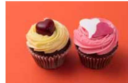
ローラズ・カップケーキ 東京 「バレンタイン・カップケーキ」 ¥648 ふんわりチョコレート生地にバニラクリーム。キュートなシュガーのハートが大人っぽいチョコレートハートをのせて。