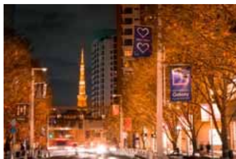
2016年の新色“CANDLE & AMBER”