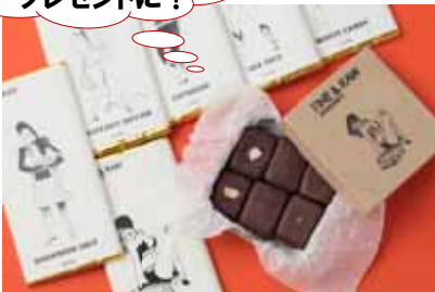
エストネーション 「トラッフルチャンキー」16個入り ¥3,456 「ピーントッパー」¥1,836 ブルックリン発のピーントッパーチョコレート。全ての原材料がオーガニック。