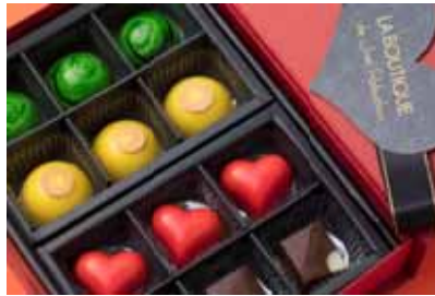
ラ ブティック ドゥ ジョエル・ロブション 「ボンボンショコラ」12個入り ¥6,480 バランス・ロドレ・風味にこだわった、ビジュアルも美しい4種類の大人なショコラ。