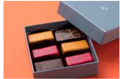
ジャン・ジュール 東京 「JG チョコレートアソート BOX」 ¥2,500 ※限定 20/日 革新的な味を提供するミシュラン店 JG よりバナナカレー味など遊び心溢れるショコラを。