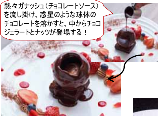
「ドーム ショコラ」 ¥1,620 (ヒルズ ダル・マツ)

熱々ガナッシュ(チョコレートソース)を流し掛け、惑星のような球体のチョコレートを溶かすと、中からチョコジェラートとナッツが登場する！ 温かいチョコレートと、ひんやりしたチョコレートアイスが絶妙なハーモニーを奏でる新感覚のスイーツ。視覚的にも、味覚的にも変化が楽しめるアトラクション型のスイーツ。プレートの上に添えられたフレッシュなイチゴと、ブルーベリーと絡めて食べると、より一層バレンタイン気分が高まります。