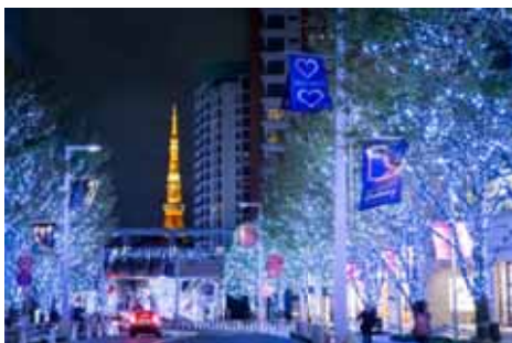
“SNOW & BLUE”