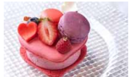
「ほろよい 大人のチェリーマカロン」 ¥730 (毛利 サルヴァトーレ クオモ)

ベルギー産チョコレート 2 種類のクリームをたっぷり挟んだエクレア。苺の酸味がアクセントです。