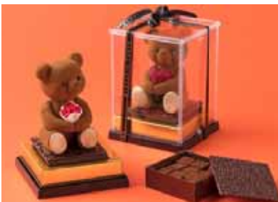
ルワンジュ トウキョウ 「NOUNOURS/ヌヌース 全3種」 ¥7,560~¥16,200 (高さ約12cm) キュートなテディベアを模したチョコレートの下に、シャンパンショコラのギモーヴが並んでいます。