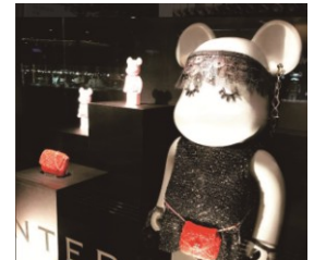
アンテプリマ ベアブリックのフォトスポット

<サービス(一例)> ※実施時間は、店舗によって異なります。なくなり次第終了のサービスもございます。