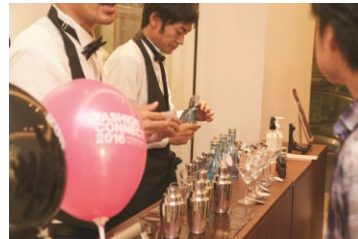
オデット エ オディール 限定フレグランスバー