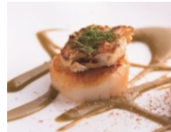
ジャン・ジョルジュ 東京 ディナーペアコースチケット