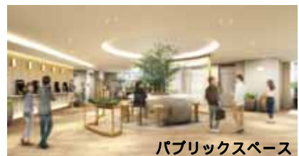
パブリックスペース

同フロアには、ビジネスコンビニ「ヒルズ 21」、「外貨両替ワールドカレンシーショップ」、靴リペア「ミスターミニット」、旅行代理店「H.I.S.」、「ATM」に加え、洋服のお直しサービスを行う「お直しコンシェルジュ ピック・ママ」と「加熱式タバコ専用ルーム」を新設、オフィスサポート機能を集約、拡充しました。