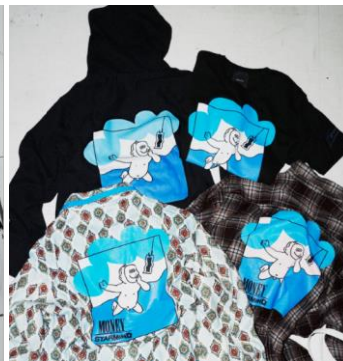
Starman by R&Co. * FACE T-SHIRT: ¥9,720, PARKA: ¥19,440, USED SHIRT: ¥25,920