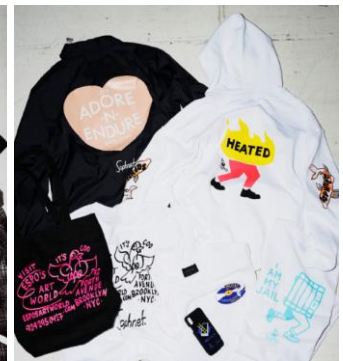
SOPH. * ESPO T-SHIRT: ¥7,560、PARKA: ¥15,120、 COACH JACKET: ¥17,280、 PHONE CASE: ¥4,320、 TOTE BAG: ¥5,400

HYPEBEAST とは、世界中のコンテンポラリーファッションからストリートカルチャーをピックアップし、発信するオンラインエディトリアル・ファッションサイトの最高峰のひとつ。2005 年に香港で設立され、オンラインストアではストリートウエアからコンテンポラリーそしてハイファッションまで、厳選されたブランドを利用者の好きな時に買える機会を提供している。