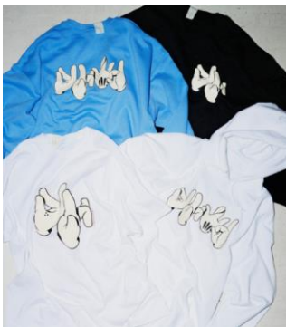
N.HOOLYWOOD * OG Slick PARKA: ¥14,040, SWEATSHIRT: ¥14,040, T-SHIRT: ¥9,720

今回は、HYPEBEAST のプロデュースで「メンズファッションゾーン」に出店する 4 店舗が参加。「N.HOOLYWOOD」と 80 年代からグラフィティシーンをリードする「OG Slick」、「ATTACHMENT」と壁画で知られるアーティスト「MHAK」、「Starman by R&Co.」とアイコンックなイラストを描く「FACE」、「SOPH.」とニューヨークベースで活躍するグラフィティアーティストの「ESPO」の 4 組が、六本木ヒルズだけの限定アイテムを開発しました。まさにここでしか手に入らない秋のメンズファッションをお楽しみください。