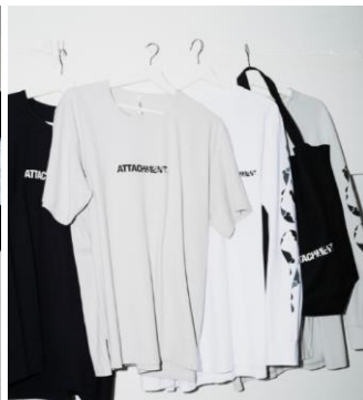
ATTACHMENT * MHAK T-SHIRT: ¥6,480, LONGSLEEVE T-SHIRT: ¥11,880, TOTE BAG: ¥3,780