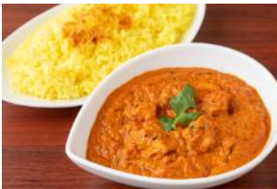
インド料理 ディヤ 『チキンティッカマサラカレー&ライス』 ¥600