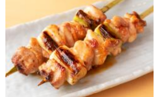
六本木 百鳥 『ネギマのたれ焼き(2本)』 ¥500