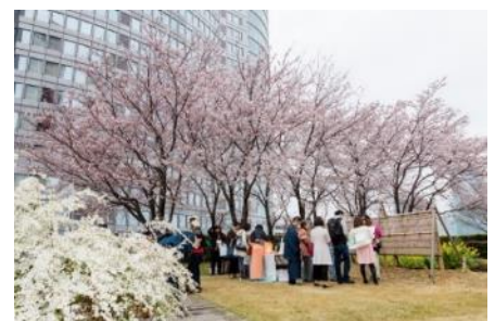
屋上庭園オープンガーデン

※未成年者は保護者同伴のご参加に限ります。 ※荒天の場合は中止になる場合があります。