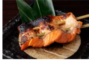
人形町 田酔 『時鮭ハラス 山椒焼き串』 ¥400