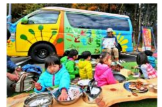
いどうしきこどもきち