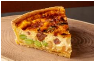
グランド ハイアット 東京 『枝豆とチヨリソーのキッシュ』 ¥600