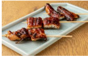
鰻處 黒長堂 『鰻串（えり・しっぽ・たんざく）』 各¥300～¥500