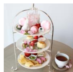
「さくら AfterMOON Tea」