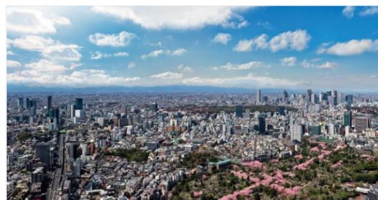
「東京シティビュー」から見える青山霊園の桜並木

六本木ヒルズ展望台 東京シティビューは、都内屈指の高さから東京タワーや東京スカイツリーなどの東京のランドマークなどの景色を鑑賞できるだけでなく、この時期は、都内各所の桜の名所を見下ろしながら鑑賞することができます。海拔 270m、都内では最も空に近い場所であるオープンエアの屋外展望台、屋上「スカイデッキ」からは、桜を上から見物する、東京シティビューならではの貴重な『天空のお花見』が体験できます。渋谷・新宿方面の眼下の広がる青山霊園の桜並木がピンクの十字として現れている様子は、この場所からしか見ることができない期間限定の貴重な景色です。