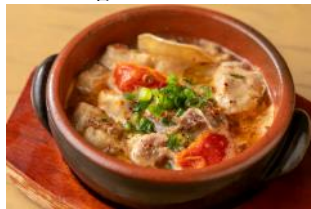
リゴレット バーアンドグリル 『スペイン風モツ煮込み』 ¥500