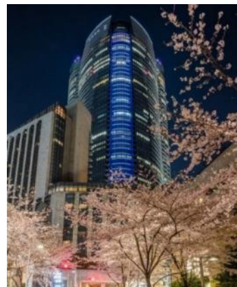
六本木ヒルズ森タワーと桜並木のコラボレーション