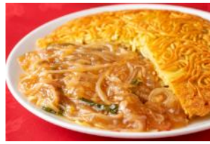
梅蘭 『梅蘭やきそば』 ¥800