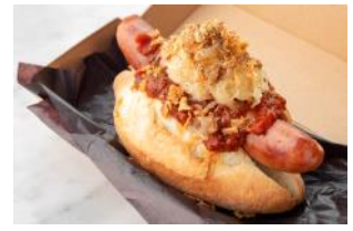
ローステッド コーヒー ラボラトリー 『ホットドッグ』 ¥800