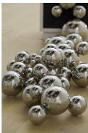
サーダン・アフィア 《ピコロ》(部分) 2008年 国立現代美術館 (PNAO) 蔵、パリ