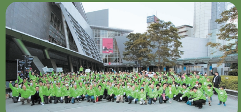
参加してくれた皆さん。お子様からご年配の方まで約340名が集合