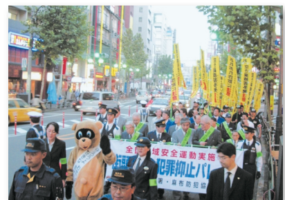
9.麻布警察主催の防犯パレードに参加 RHNA joins in the Crime Prevention Parade sponsored by the Azabu Police.