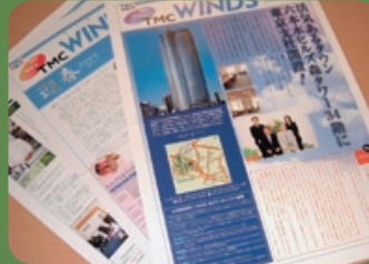
トータルメディカルコンサルタント社内報の「WINDS」