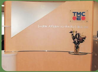
六本木ヒルズ34F東京支社のエントランス。本社は名古屋

Providing multifaceted support for both the management and operation of medical care organizations, TMC is a comprehensive medical consulting company. With top priority on "Customer Satisfaction", TMC plays a proactive role in the improvement of medical care service by offering total consultation on Human Resources, Medical Care and Information needs.