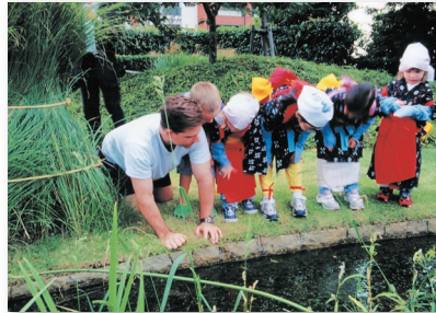
2.屋上の小川に生息する生き物にも興味深々 Fascinated by the thriving life in the rooftop brook.