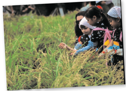
3.福井県コシヒカリ約60kgを収穫 This year's harvest, 60kg of "Koshihikari" grown from Fukui prefecture seeds.