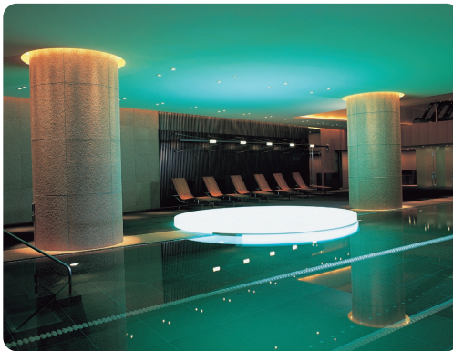
NAGOMI スパ アンド フィットネス(グランド ハイアット 東京5F) 営業時間 5:30 - 22:00 TEL 03-4333-8825