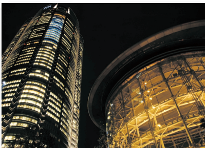
4.秋の夜長の六本木ヒルズ Lengthening nights of autumn in Roppongi Hills.