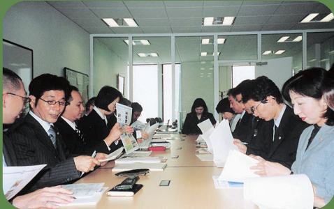
東京支社でのマネージャー会議の様子