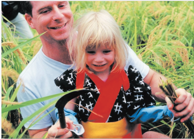
1.刈女衣装に身を包んで稲刈りに初挑戦 Harvesting rice dressed in traditional garb.

特集 “六本木ヒルズカップ2006” フットサル大会レポート Special Feature ROPPONGI HILLS CUP 2006 FUTSAL CHAMPIONSHIP REPORT