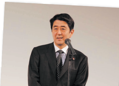
7.東京国際映画祭に安倍総理もご来場 Prime Minister Shinzo Abe delivers a speech at the Tokyo International Film Festival.