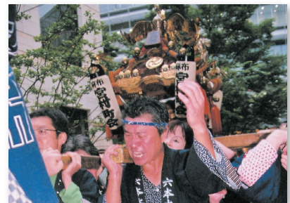
6.宮村町会のお神輿に自治会員も参加 Roppongi Hills Neighborhood Association members also shoulder the Miyamura Neighborhood Association portable shrine.