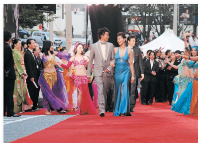
8.華やかに開催されたけやき坂レッドカーペット Keyaki-zaka "Red carpet" welcomes a galaxy of stars again this year.