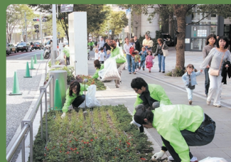
レッドカーペットの舞台となっただけやき坂も清掃

Led by the TIFF Minato Committee, which is comprised of the Roppongi Hills Neighborhood Association and other neighborhood and merchant's associations in the Roppongi and Azabu areas, a large-scale Clean Up Project in Roppongi was undertaken on October 14 (Saturday) to make our town spic-and-span for film festival visitors. Surpassing 2005 participation, the 340 volunteers collected over one hundred 30-liter bags of trash this year.