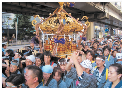
5.2年に一度の天祖神社のお神輿 Once every 2 years, Tenso Shrine's "mikoshi" (portable shrine) makes an appearance.