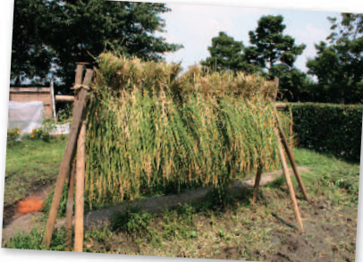
7. 今年もヒルズ米は大豊作! @ 稲刈りイベント Another good rice harvest in the Hills @ Harvesting rice event