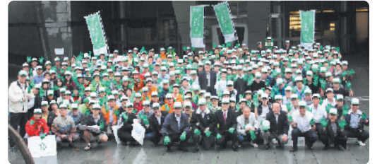
掛け声はゴー! ゴー! ゴー!

Rain did not dampen the spirits of the 282 people who came out for the Tokyo International Film Festival Minato Clean Up. Mayor Takei and film festival chairman Yoda as well as representatives of the police, fire department and neighborhood associations joined in cleaning up our community. As a token of appreciation for participation, everyone who took part received complimentary movie tickets! (This year we collected a total of 22 90-liter bags of trash.)