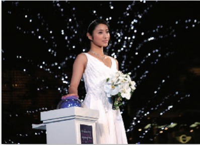
1. 今年のSnow Queenは石原さとみさん @ げやき坂イルミネーション点灯式 2008 Snow Queen Satomi Ishihara @ Keyakizaka Illumination Light Up Ceremony