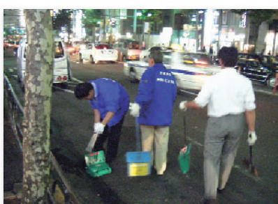
8. 祝500回! @ 六本木をきれいにする会 Commemorating the 500th event! @ Roppongi Clean Up