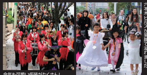
今年も可愛い仮装がたくさん!

10月25日(土)「HAPPY! HALLOWEEN 2008」のメインイベント、ハロウィンパレードが行われました。六本木ヒルズのパレードは、仮装をしていればどなたでも参加OK。事前申し込みも不要なので、来年は是非みなさんご参加下さい。