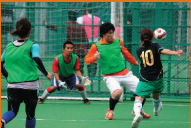
真剣勝負! 白熱した試合が繰り広げられました

At the Friendship Futsal Tournament on October 25 (Saturday), 2008, teams of office workers from ARK Hills, Roppongi Hills and Atago Green Hills vied to take home the Hills Cup 2008.