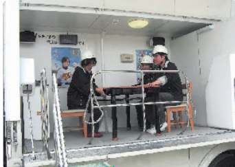
起震車体験の様子