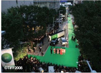
2. グリーンカーペットでエコアピール @ 東京国際映画祭 Green Carpet sends an eco-friendly message @ Tokyo International Film Festival