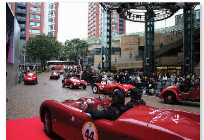
6. クラシックカーが六本木ヒルズを疾走! @ ミッレミリア2008 Classic cars roar through Roppongi Hills @ La Festa Mille Miglia 2008