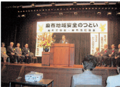
4. 慌てないでまずは確認を! @ 振り込め詐欺防止PRイベント "Don't panic! Confirm first!" @ "Furikomesagi" (Swindling of Senior Citizens) Prevention PR Event