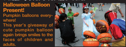
風船をもらって皆笑顔

今年もカボチャの風船プレゼントを実施しました。可愛い風船に子供も大人も大喜びでした。