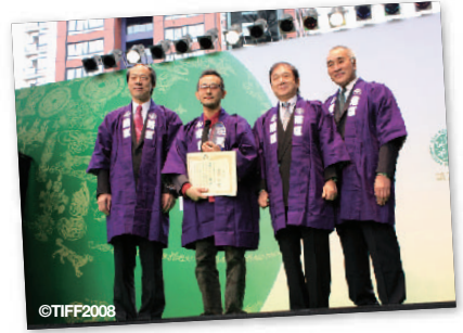
3. 観客が選ぶ観客賞。今年も地元のみんで表彰しました @ 東京国際映画祭 Audience Award presentation by local fans @ Tokyo International Film Festival