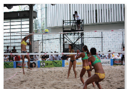
9. アリーナにビーチ出現!? @ ビーチバレー: JBVチャンピオンズカップ Is that a beach in the Arena!? @ Beach Volleyball: JBV Champions Cup