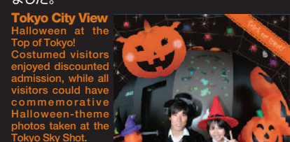
仮装グッズをレンタルして記念撮影

仮装すると入館料が割引に。東京スカイショットでは、ハロウィンバージョンのフレームが登場しました。