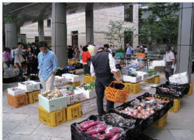
5. 秋野菜を求めて早朝から大盛況 @ いばらき市 Autumn veggies attract early morning shoppers @ Ibaraki Market