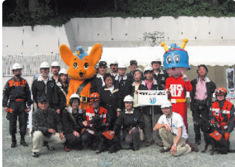
ビーボ君、キュータ、災害救助犬と一緒に記念撮影

At the general disaster drills organized by Minato Ward, our Association was represented by 19 people including directors of various committees such as the crime prevention and disaster prevention committees. Though the drills were fundamentally the same as in previous years, the message of the importance of repeated drilling inspired participants to greater efforts.