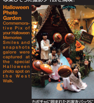
カボチャに囲まれたお家をバックにハイチーズ♪

今年もウェストウォークにフォトスポットが登場。家族連れで、カップルで、みんな楽しそうに撮影タイムを満喫!