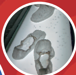
宮永愛子「屈の屈く朝」 (部分) 2008年 (釜山ビエンナーレ2008) 水櫃、ナフタリン、ミクストメディア