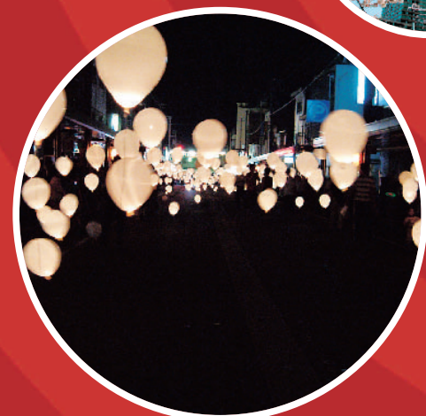
「GINGA」2003年 越後妻有アートトリエンナーレ2003 (新潟)